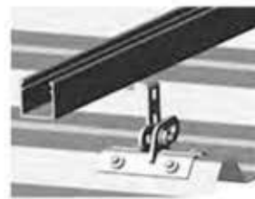
Montage von Schienen mit unten liegendem Schraubkanal

Für Schneefang- und Fallschutz- Anwendungen nicht geeignet !